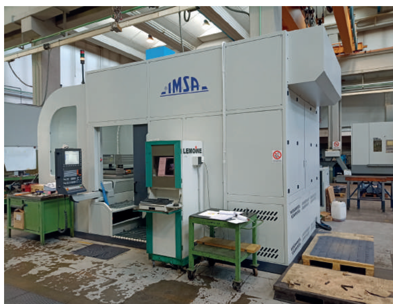
La foratrice MF1250/2FL al lavoro a Carate Brinaza (MB) da pochi mesi.

Nello stabilimento di oltre 5.500 m 2 di Carate Brianza avvengono le lavorazioni meccaniche principali, a partire dalla sgrossatura dei blocchi d'acciaio per dare la prima forma allo stampo, passando per la semi-finitura e finitura, la foratura e l'erosione.