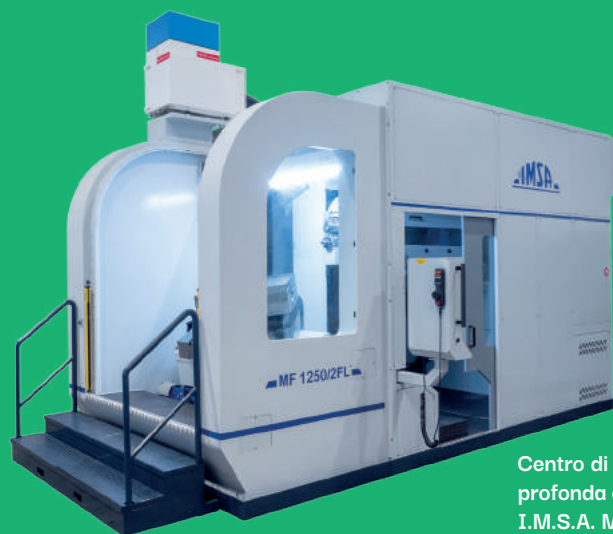
Centro di foratura profonda e fresatura I.M.S.A. MF1250/2FL.

La foratrice MF1250/2FL è equipaggiata con un controllo Heidenhain TNC 640 con cicli di foratura profonda appositamente sviluppati dai programmatori I.M.S.A. in stretta collaborazione con il costruttore del CNC.